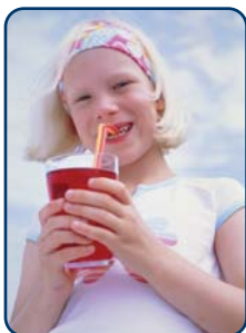
Er worden vaker en meer fris- en sportdranken gedronken

Alle kinderen zijn er gek op: snoep en frisdrank. Alle ouders weten wel dat je van snoepen gaatjes krijgt. Er zit namelijk veel suiker in. Veel minder ouders weten dat in veel zoete producten ook zuren zijn verwerkt. Je proeft ze niet, want de zoete smaak overheerst. Maar die toegevoegde zuren in voeding en dranken veroorzaken wel een ander probleem voor het kindergebit: tanderosie. Het tandglazuur van de nieuwe blijvende tanden van uw kind is nog niet volledig uitgehard. Daarom is het kindergebit extra kwetsbaar voor zuren.