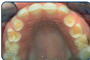
Tanderosie bij een kind van 8 jaar

Tanderosie ziet u pas in een vergevorderd stadium. Als het uiterlijk van de tanden of kiezen verandert. Te laat dus. Gelukkig kan de tandarts of mondhygiënist het eerder ontdekken. Door tanderosie kunnen de voortanden korter en dunner worden (dus kwetsbaarder voor breuk) of ze krijgen doorschijnende en rafelige randen. Verder kunnen de tanden plaatselijk steeds geler worden of donkere plekken krijgen. Het glazuur wordt namelijk dunner en het onderliggende gele tandbeen schijnt er dan doorheen. In de knobbels van de kiezen kunnen putjes ontstaan. In een later stadium kunnen de knobbels van de kiezen zelfs helemaal verdwijnen. Dan kauwt uw kind dus op het tandbeen. Dat geeft pijnklachten en gevoeligheid.