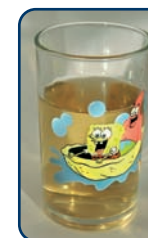
Ook appelsap is een zuur tussendoortje

Behalve goed poetsen, napoetsen en controle, is het belangrijk dat u goed op de voeding van uw kind let. Zowel suiker (gaatjes) als zuur (erosie) kunnen het gebitt beschadigen. Beperk daarom het aantal eet- en drinkmomenten tot maximaal zeven per dag. Drie keer een maaltijd en maximaal vier keer per dag een tussendoortje. Het gaat niet alleen om hoe véél zure producten uw kind eet en drinkt. Het gaat vooral om hoe vaak, hoe lang, de tijdstippen en de manier waarop dat gebeurt. Tanderosie is slijtage van het tandglazuur door zuurinwerking. Het is een sluipend proces dat niet gemakkelijk te herstellen is.