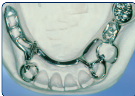
Frameprothese in wording op een gipsmodel, zonder kunsttanden en -kiezen

soort slotje. Bij een slotje wordt de ene kant vastgemaakt aan een kroon, tand of kies en de andere kant zit vast aan de frameprothese. De frameprothese kunt u op die manier in het slotje schuiven. Het slotje zit doorgaans aan de binnenkant van de tanden en kiezen en is dus niet vanaf de buitenkant zichtbaar. Ankertjes zijn vaak wel enigszins zichtbaar.