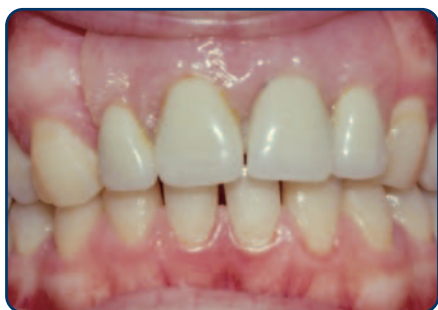
Plaatprothese van voren

De plaatprothese is gemaakt van een roze, tandvleeskleurige kunsthars. Daarin zijn de kunsttanden en -kiezen verankerd. De gehele plaatprothese rust op het slijmvlies van de mond. Deze zit eventueel met ankertjes vast aan overgebleven tanden of kiezen.