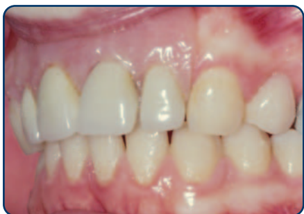
Plaatprothese van opzij