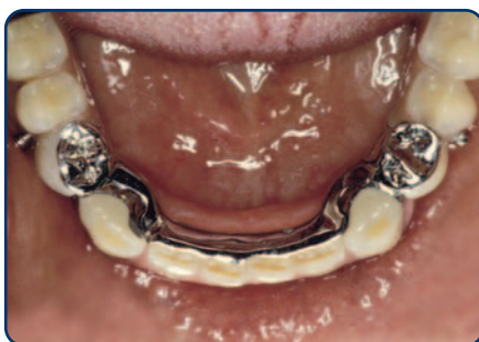
Frameprothese met verankering op kronen